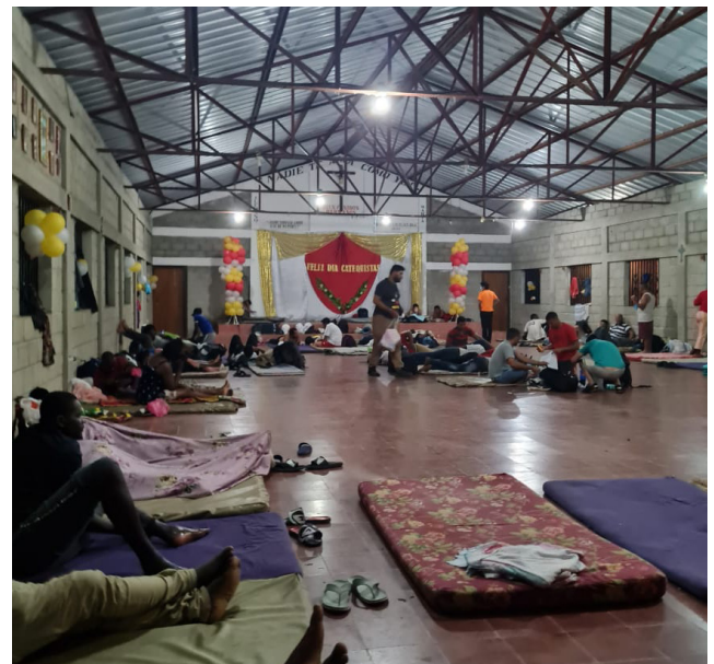
El salón del Centro Pastoral Católico en Trojes funciona de domingo a miércoles y tiene capacidad para recibir hasta 80 personas.