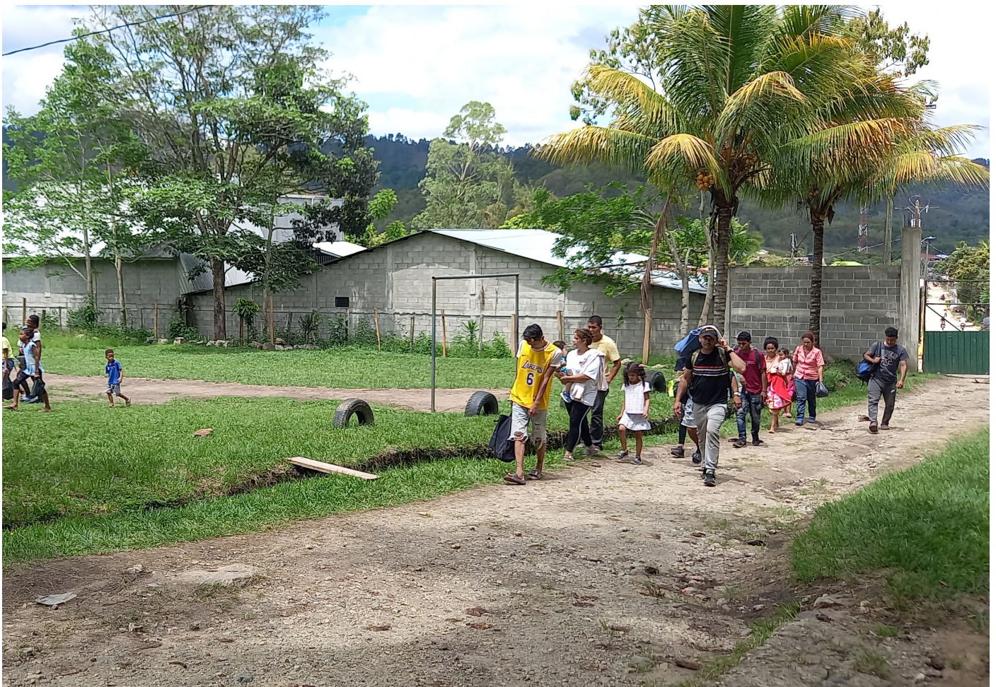
Un grupo de migrantes en tránsito ingresa al Centro Pastoral del municipio de Trojes, El Paraíso.

Hasta el 29 de mayo de este año, según las estadísticas del Instituto Nacional de Migración (INM) han ingresado a Honduras 37.892 personas migrantes irregulares en tránsito, siendo en su mayoría de origen cubano, venezolano, ecuatoriano, haitiano, angoleño, senegalés, brasileño, nicaragüense y camerunés, entre otros.